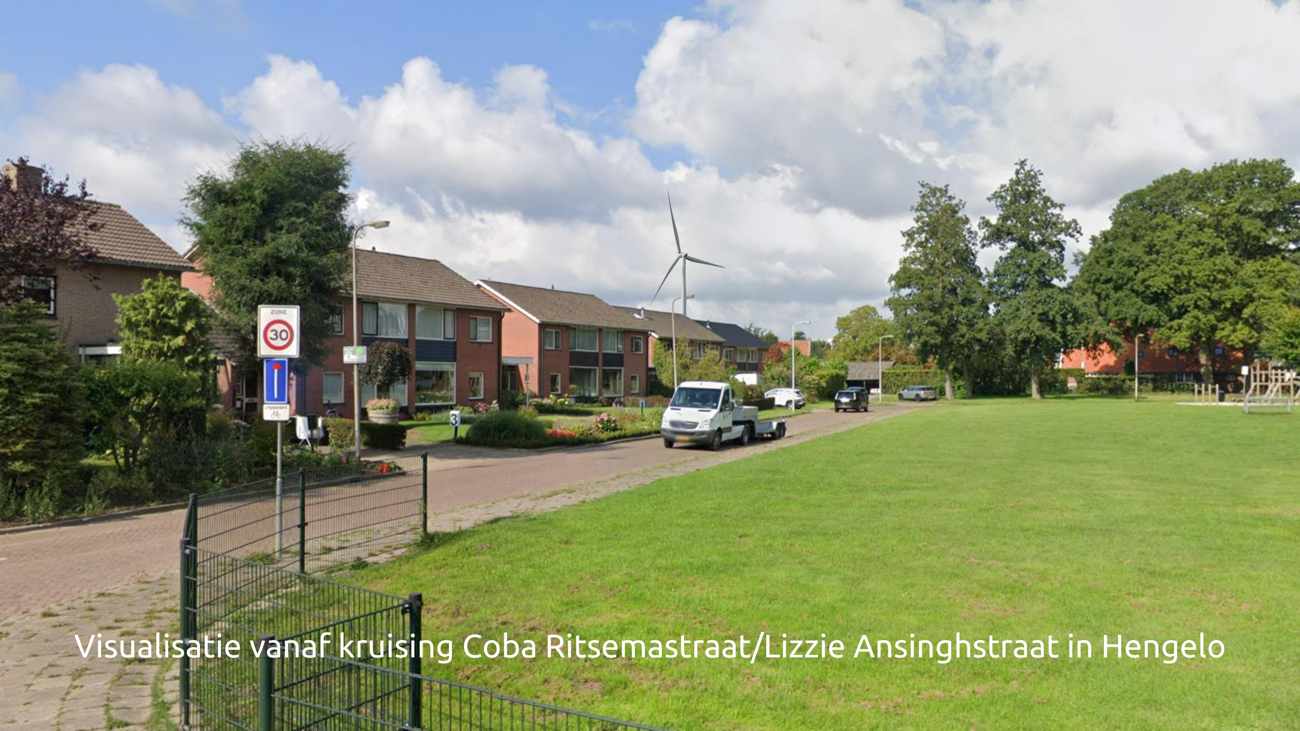
Visualisatie vanaf kruising Coba Ritsemastraat/Lizzie Ansinghstraat in Hengelo